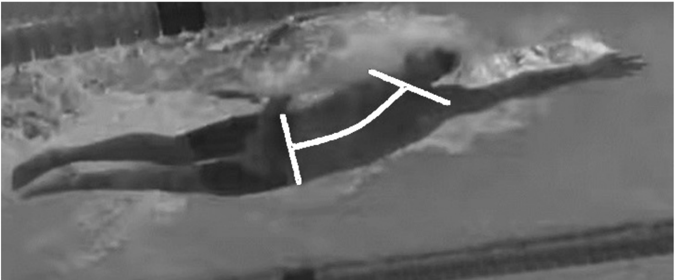
Рисунок 4 – Положение туловища при выполнении вдоха в сторону (на фото Григорио Палтриниери) Figure 4 – The position of the torso when inhaling to the side (pictured by Gregorio Paltrinieri)

наружена статистически значимая взаимосвязь между изменениями осанки и типом дыхания. Ученые отметили, что у пловцов, которые при плавании кролем на груди дышали только в правую сторону, наблюдалось поднятие левого плеча и выпуклый сколиоз слева [20]. Позже авторы (Zaina et al., 2015; Canan et al., 2019; Zwierzchowska et al., 2023) в своих работах показали, что плавание было связано с повышенным риском асимметрии туловища. А группа ученых Zaina et al. отмечает, что самый высокий риск возникновения сколиоза среди пловцов был обнаружен у представительниц женского пола [29]. Исследователи Wojtys et al. справедливо указывают, что изменения позы в долгосрочной перспективе могут перерасти в хронические процессы, которые, во-первых, могут ограничивать возможности человека к выполнению эффективных двигательных действий и, во-вторых, приводить к повышенному риску возникновения травм [26].