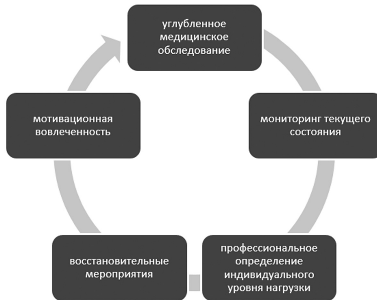
Рисунок 1 – Комплексное сопровождение в профессиональном спорте Figure 1 – Comprehensive support in professional sports