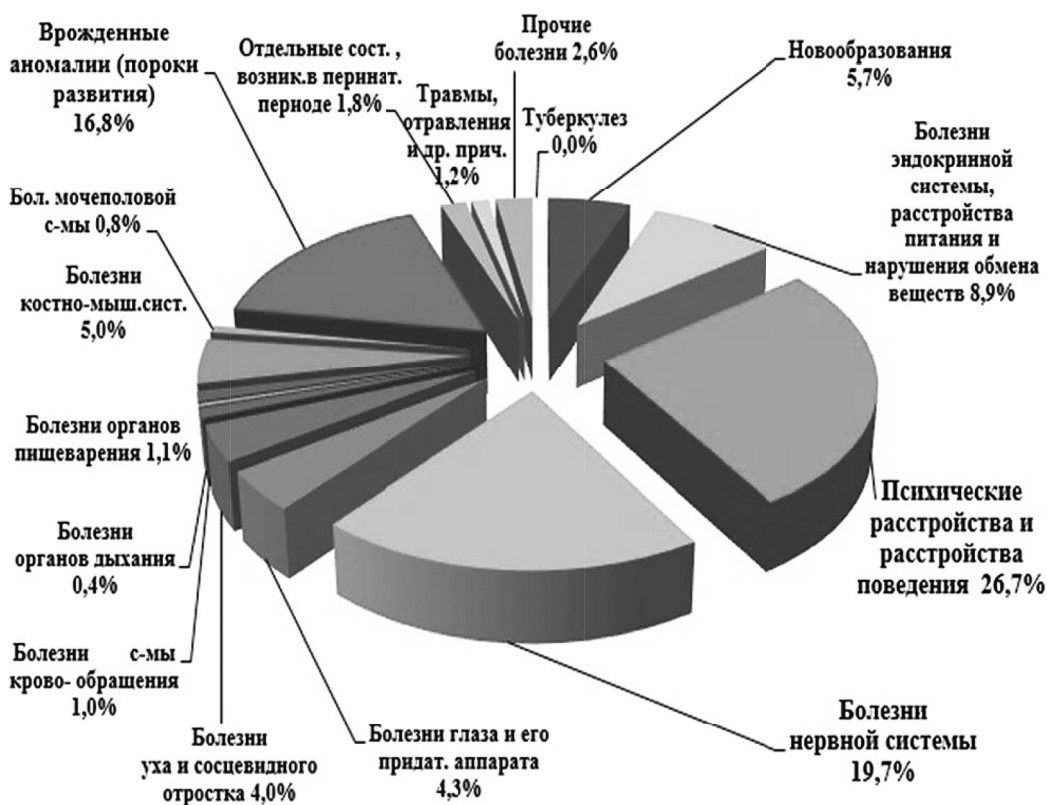
Рисунок 1 – Структура инвалидности детей в возрасте до 18 лет в Республике Татарстан по классам заболеваний в 2017 году (в %)

нениями в состоянии здоровья и отмечают, что расширение двигательных возможностей этих детей является главным условием подготовки их к полноценной жизнедеятельности. Зотова Ф.Р. указывает на то, что в настоящее время все более осознается тот факт, что традиционные, издавна сложившиеся и используемые на практике формы физкультурно-спортивной работы с детьми и молодежью уже не отвечают современным требованиям и должны быть заменены новыми, более эффективными. Поэтому сегодня идет интенсивный поиск новых идей и подходов к организации физкультурно-спортивной работы [1]. Известно, что для успешной социальной адаптации умственно отсталых детей необходим достаточно высокий уровень развития физических качеств, который будет являться предпосылкой к коррекции их двигательных нарушений [5,6,7]. Следует отметить, что умственно отсталые дети не способны к длительным, монотонным тренировкам, которые часто необходимы для выработки тех или иных компенсаторных навы-