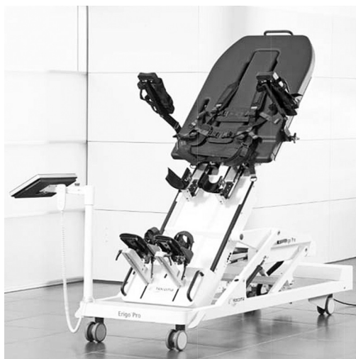
Рисунок 1 – Вертикализатор ERIGOPRO Figure 1 – ERIGOPRO Verticalizer